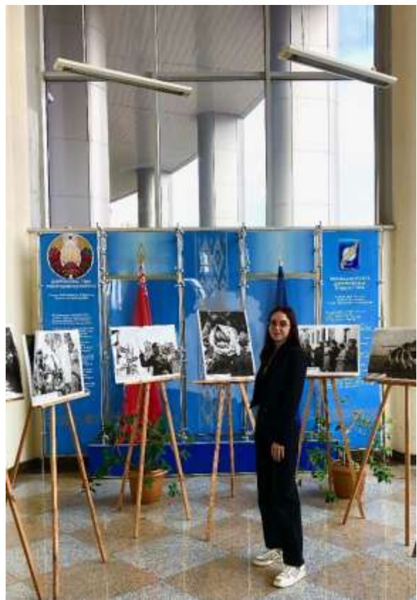
Студенты ВолГУ участвуют в программе международной академической мобильности.