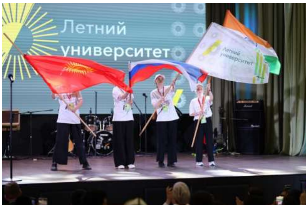
Летний университет 2024 (УрФУ)