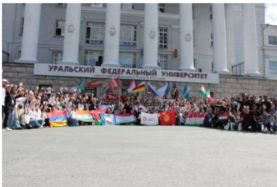
Участники Летнего университета 2024 (УрФУ)