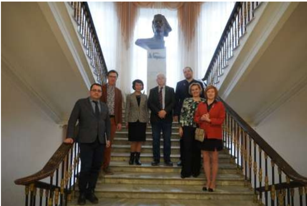
16 апреля 2024 г. - круглый стол «Трудовой подвиг народов СССР во время Великой Отечественной войны 1941–1945 годов»;