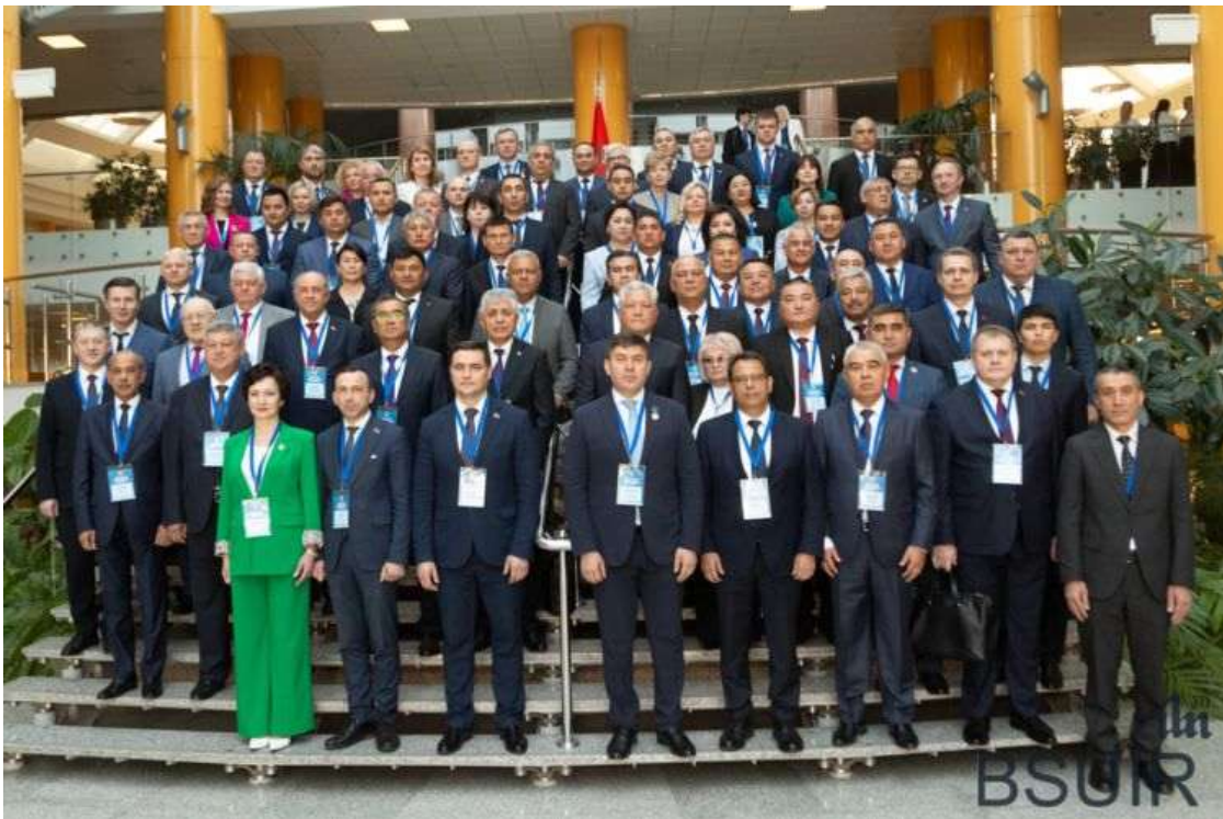
БГУИР принял участие в XI Форуме регионов Беларуси и России