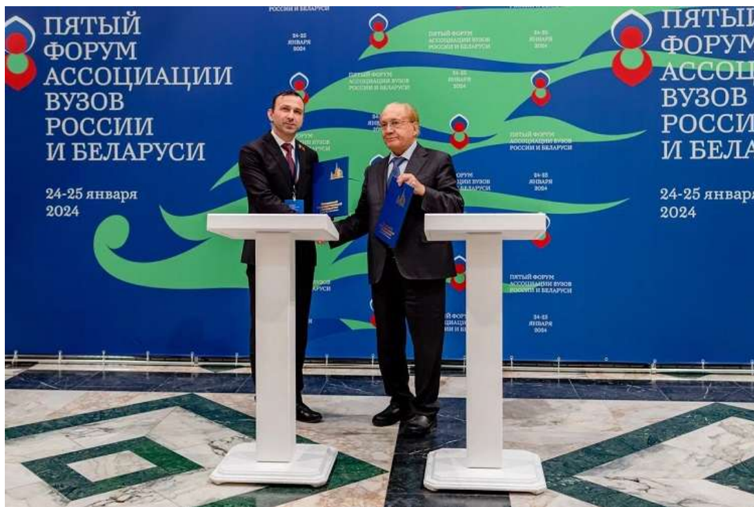
II Форум регионов Беларуси и Узбекистана