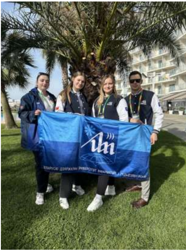
Курсанты БГУИР одержали победу на международной олимпиаде по информатике в Военной академии связи им. С.М. Буденного Министерства обороны Российской Федерации (г. Санкт-Петербург)