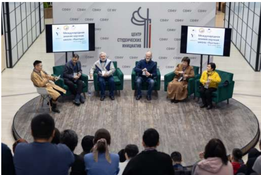
Открытие Международной научной школы Кыстык