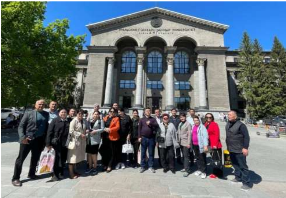
Программа повышения квалификации ИППК УГИ УрФУ «Актуальные подходы в преподавании дисциплин социально-гуманитарного профиля», для 30 преподавателей Бухарского государственного университета (Узбекистан г. Бухара).