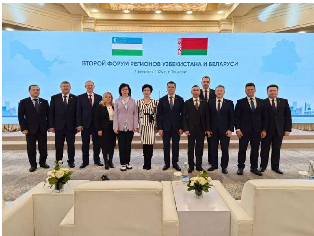
Делегация БГУИР приняла участие в ВФМ-2024