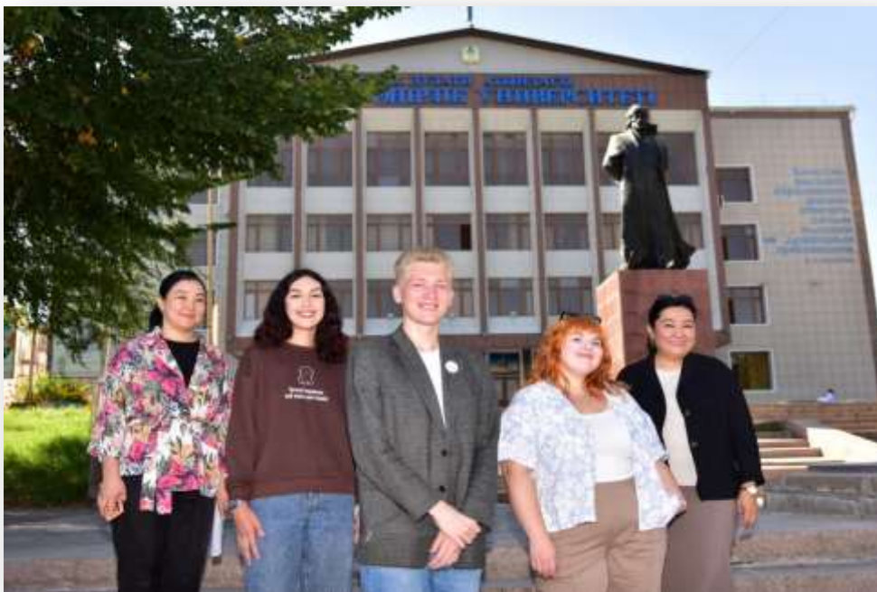
Студенты АНО ВО "Университет при МПА ЕвразЭС" в Университете Дулати