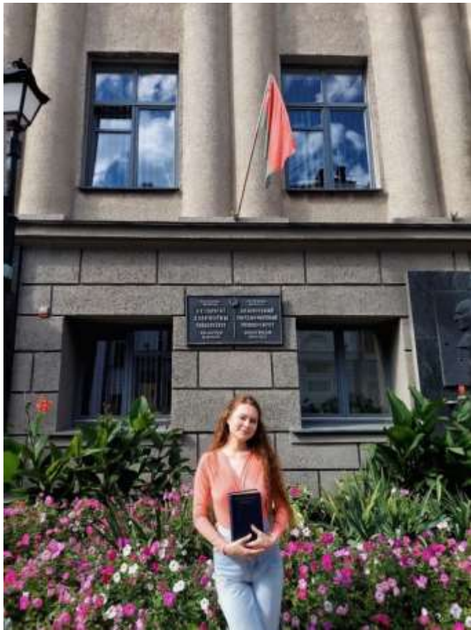
Участие студентов в программе международной академической мобильности