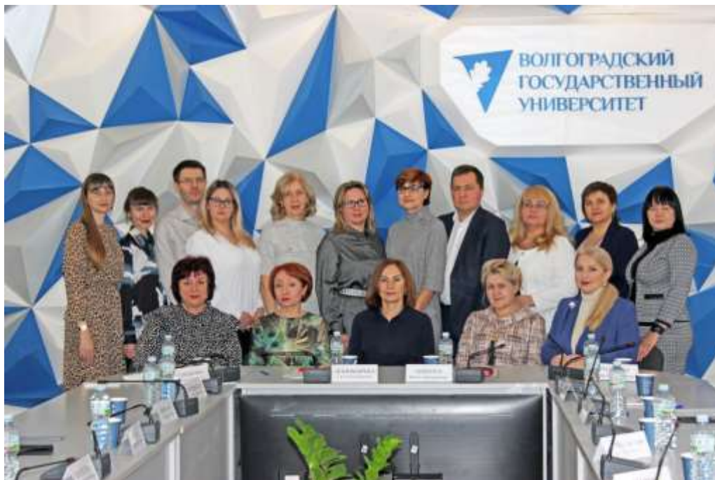
Международный круглый стол «Стратегия и тактика правового развития биржевой предпринимательской деятельности РФ»