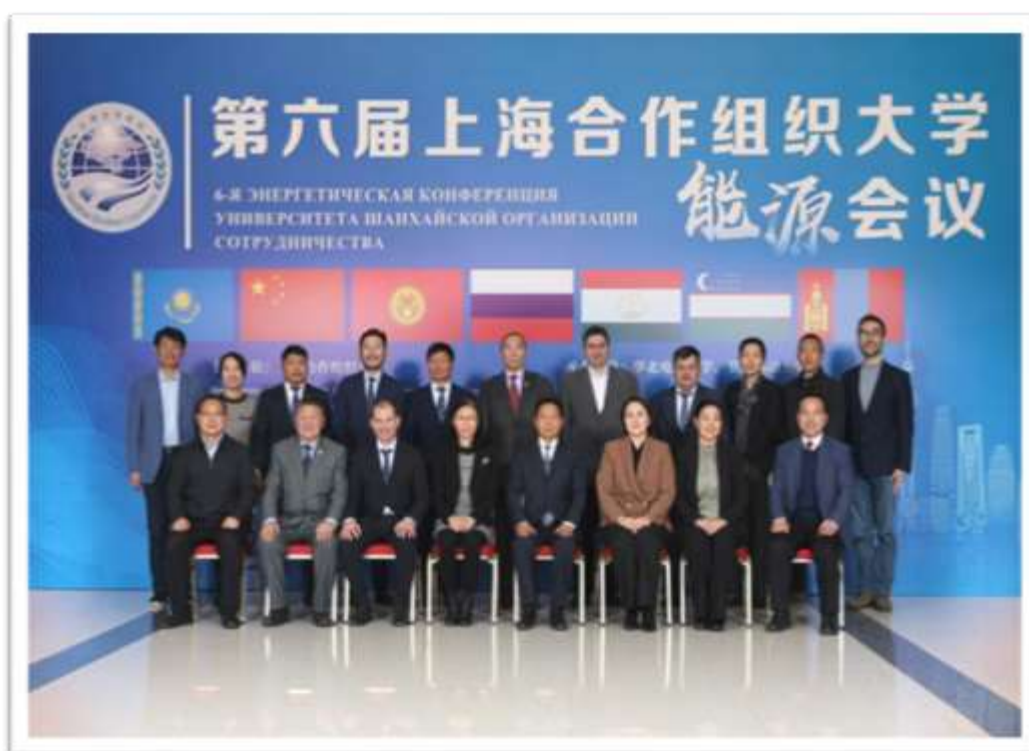
6-ая Энергетическая конференция университета ШОС, Пекин, КНР

1. 30 ноября 2023 года делегация университета Дулати принимала участие в 6-ой Энергетической конференции университета ШОС, которая проходила в городе Пекин, КНР на базе Северо-Китайского электроэнергетического университета. Цель данной конференции создание платформы для академических обменов, повышение взаимной поддержки и содействие стратегическому развитию государств-членов ШОС, совместная реализация проекта «Один пояс, один путь». В конференции принимали участие вузы КНР, РФ, Монголии и Казахстана.