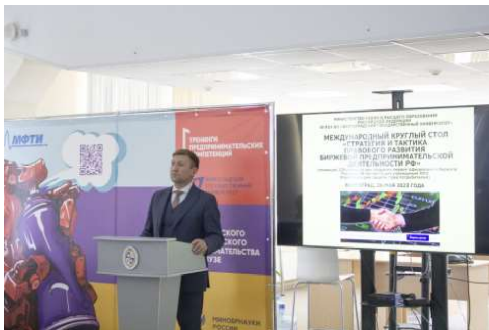
Круглый стол «Международное значение битвы за Сталинград»