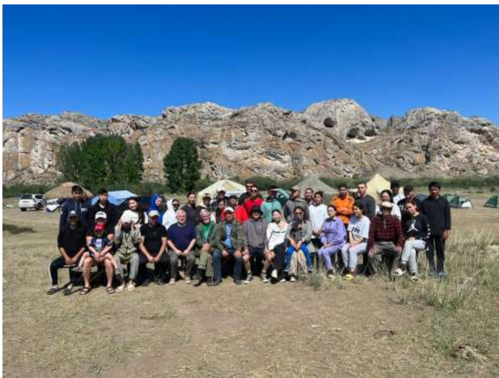
Летняя школа, Казахстан