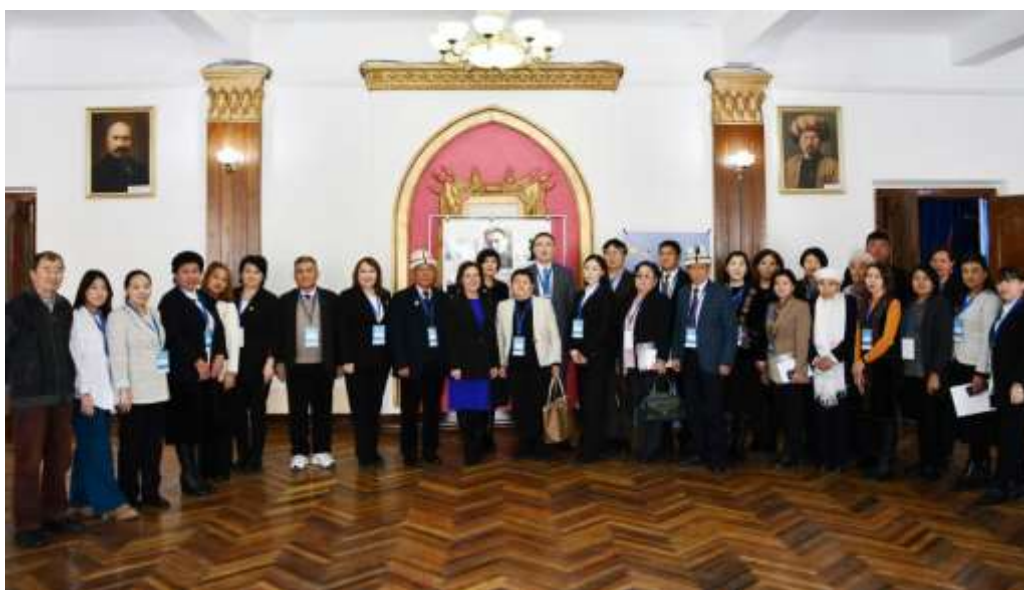
Международная НПК «Роль лидеров в формировании наций и развитии общества и культуры в XX-XXI вв.», Кыргызстан