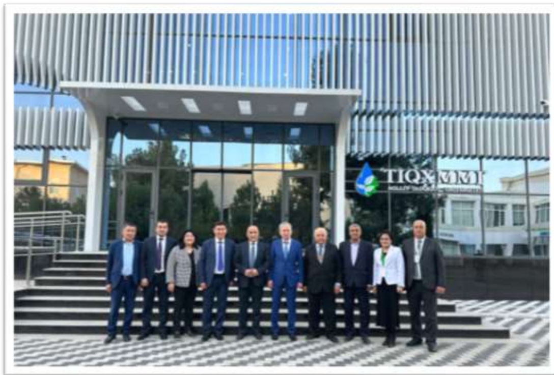
НИУ «Ташкентский институт инженеров ирригации и механизации сельского хозяйства» (ТИИИМСХ)

3. С 2023 года запущен дудипломный проект с Российским химико-технологическим университетом имени Д.И.Менделеева (РХТУ) по формату «2+1+1», где два года обучения будут проходить в Университете Дулати, один год в РХТУ и один год в ТОО «Казфосфат». Были направлены 7 студентов вуза в РХТУ на обучение по сетевым образовательным программам 3 курса. Также, запущен проект «Менделеевские классы» для школьников 10-11-х классов горорда Тараз. Создан план повышения квалификации, переподготовки, стажировок профессорско-преподавательского состава Университета Дулати в г. Москва. Разработаны основные профессиональные образовательные программы и планы обучения для бакалавриата по направлениям подготовки: «Химическая технология» профиль Технология неорганических веществ, «Химия» профиль Аналитическая химия. 19 января 2024 года состоялось открытие филиала РХТУ им. И.Менделеева в Республике Казахстан на базе Университета Дулати.